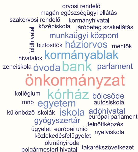
2. ábra A terepeken megjelenő oktatási, egészségügyi, közigazgatási és pénzügyi szereplők interjúkban megnevezett típusa szófelhőben ábrázolva 2

A különböző oktatási intézmények, egészségügyi ellátást nyújtó intézmények, közigazgatási adminisztrációt és ügyintézéseket biztosító intézmények, valamint a pénzügyi szolgáltatásokat biztosító intézmények mindegyik fókuszcsoporthoz említésre kerültek. Az, hogy az egyes intézménytípusokhoz milyen példákat nevesítettek a fiatalok, változó képet mutatott. Az oktatás tekintetében a bölcsőde, óvoda és iskola mindegyik helyszínen felmerült, egy fővárosi csoportban pedig tovább tágították ezt a kört a nyelviskolákkal, felnőttképzést nyújtó intézményekkel és autósiskolákkal. Az egészségügy esetében elsődlegesen a kórházakat és több helyen a háziorvosi ellátást emelték ki, valamint a gyógyszertár merült fel, egy-egy terepen pedig speciálisabb egészségügyi tevékenységet nyújtó intézmények is szóba kerültek úgy, mint mentők, sürgősségi ellátás, járóbeteg szakellátás. A közigazgatási és adminisztratív segítséget nyújtó intézmények tekintetében rendkívül gyakran, szinte minden helyszínen nevesítették a kormányablakokat és az önkormányzatokat. Ebben az intézménytípusban jelent meg egy erőteljesebb különbség: a két budapesti fókuszcsoporthoz felmerültek olyan nemzetek felett álló szervezetek is, mint Európai Unió vagy Európai Parlament, melyeket a többi beszélgetésben nem jelöltek meg. A pénzügyi intézmények vonatkozásában gyakori említett példaként szerepeltek a bankok.